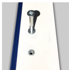
Foto: Element mit Blindnietmutter zur Befestigung der Rosette

Durch die Aussparung an der Rückseite auf Höhe der Befestigungslöcher ist die blaugelb Cliprosette PZ oval auch für Elemente geeignet, die bei der Befestigung Blindnietmutter mit Rand einsetzen. Ein 100%iges planes Aufliegen ist damit gewährleistet.