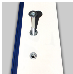
Foto: Element mit Blindnietmuttern zur Befestigung der Rosette

Durch die Aussparung an der Rückseite auf Höhe der Befestigungslöcher ist die blaugelb Schieberosette PZ ZA oval BNM auch für Elemente geeignet, die bei der Befestigung Blindnietmutter mit Rand einsetzen. Ein 100%iges planes Aufliegen ist damit gewährleistet.